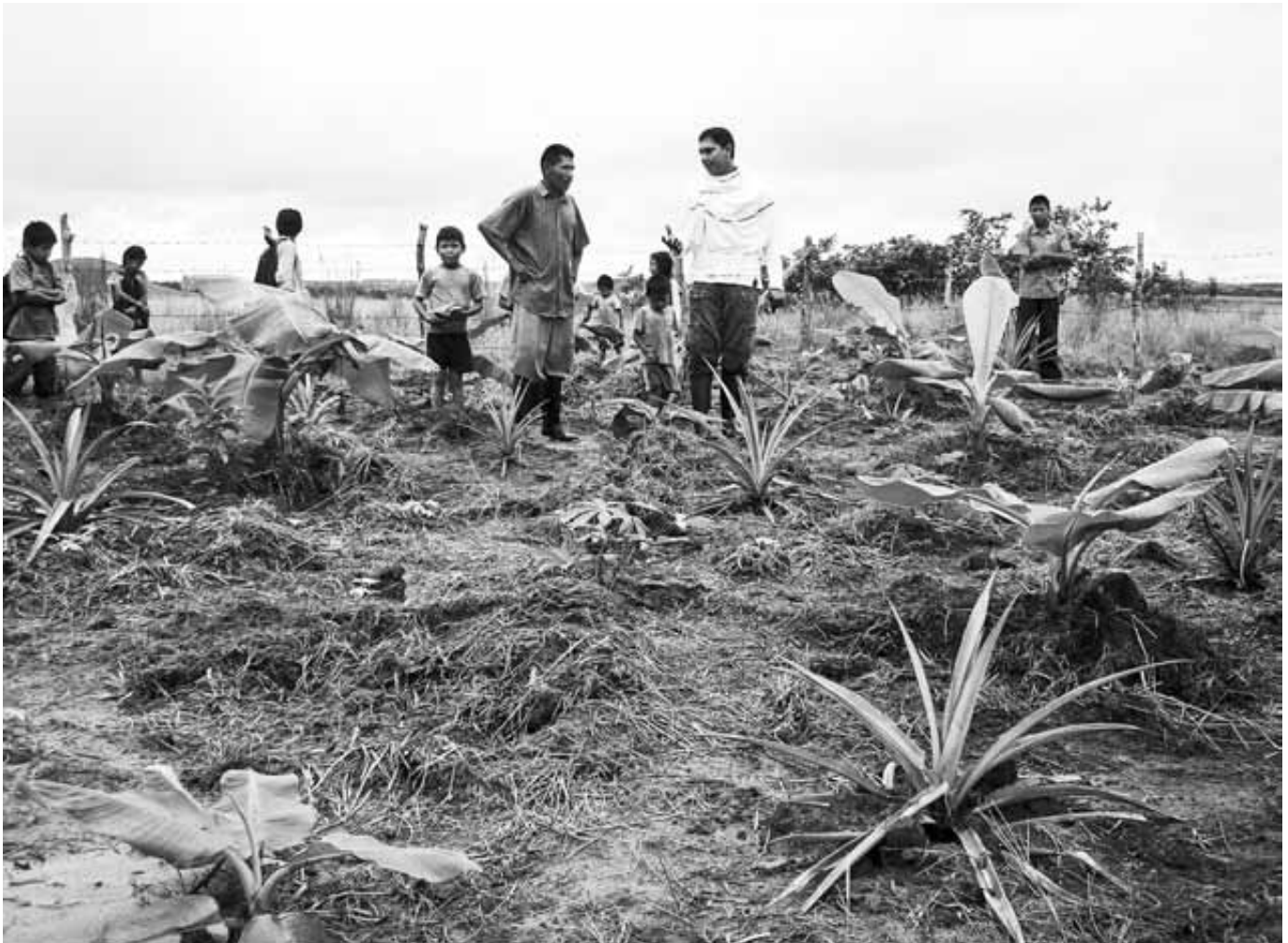
Se aprecian estas mismas sabanas en proceso de transformación, para convertirse en centros de vida y de producción.