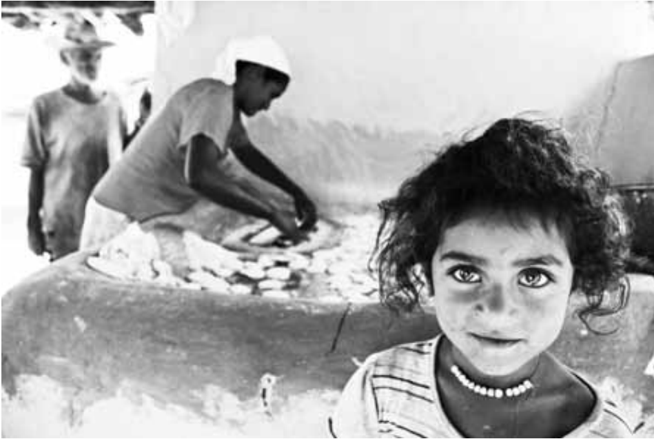
Povo Xacriabá-S. João das Missões-MG-Medio São Francisco

les, especialmente cuando “el oro y otros metales preciosos constituyeron más de 53% de las exportaciones peruanas a Canadá en 2007”.