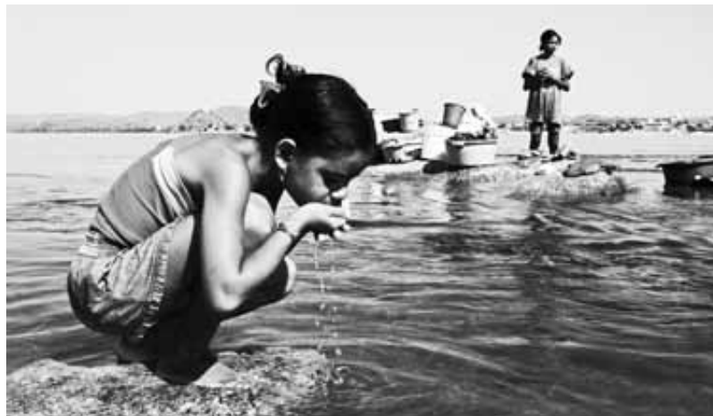
Niterói-E-Baixo São Francisco

Una de las últimas novedades es el proyecto de Suzano Papel e Celulose de realizar grandes plantaciones de eucaliptos para producir biomasa de madera en el nordeste de Brasil. Suzano es una empresa privada que funciona desde hace 85 años. Es el segundo productor de pasta de madera del mundo, con cinco fábricas de celulosa en Brasil, ubicadas en los estados de San Pablo y Bahía, que produjeron en 2008 2 millones 700 mil toneladas de pasta y papel. Hoy en día controla 722 mil hectáreas de tierra donde hay 324 mil hectá-