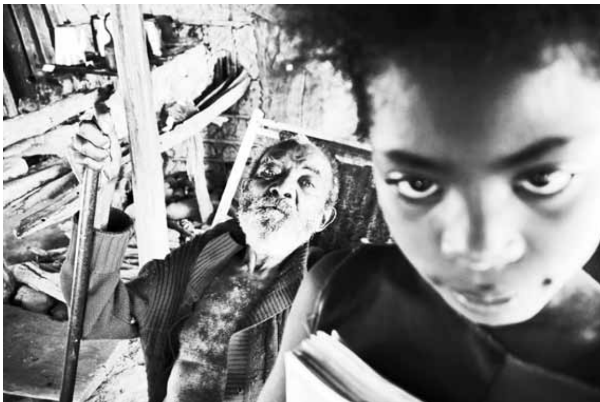
Ilha da Ressaca-MG-Médio São Francisco