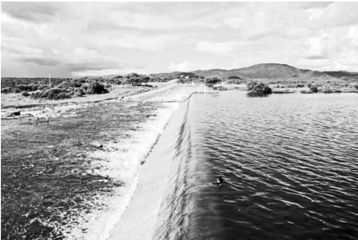
Açude Souza-Canindé-CE Maio, 2009

Y si las mentadas concesiones no existen, o no aparecen, recordemos que luego es difícil encontrar los documentos oficiales que evidencien la construcción de la infraestructura necesaria para los sitios de acceso de las mineras, pues los permisos pueden transferirse a los municipios y éstos tal vez los enmascaren con obras a beneficio de los ejidos, carreteras o pozos de agua, que las comunidades autorizan sin saber que están firmando directamente la destrucción de sus pueblos.