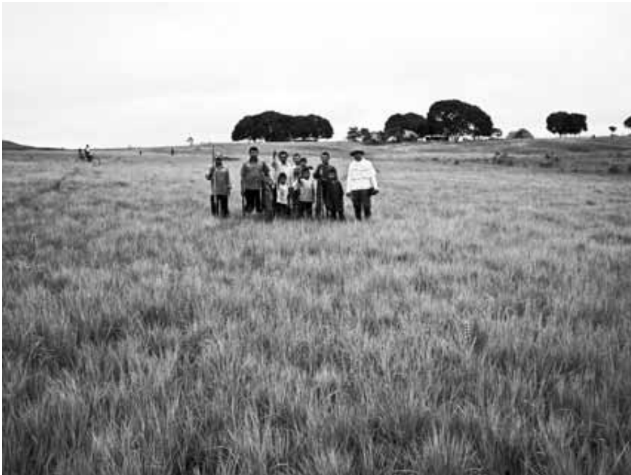
Las sabanas en su estado natural.