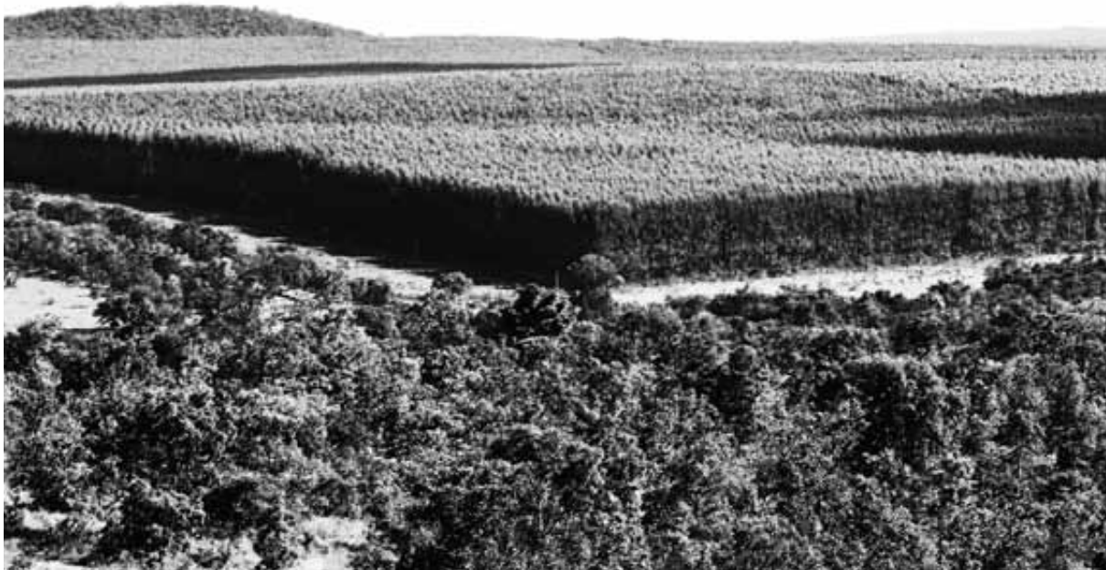
Três Marias, Minas Gerais