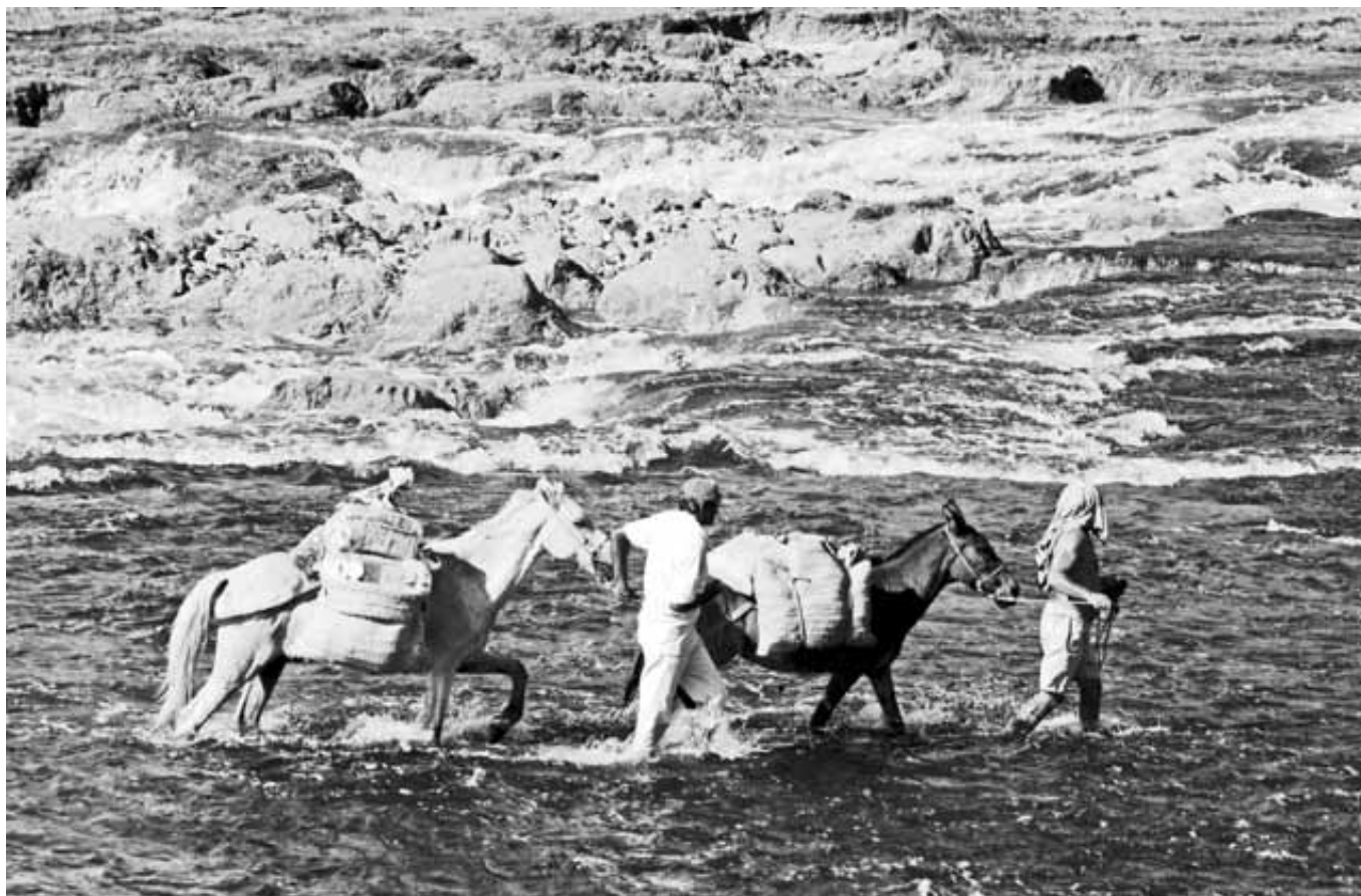
Rio Salão, Açude Souza-Canindé-CE Maio, 2009

Pese a eso, la resistencia continua, pues antes de la modificación al Código Minero el Estado tico aceptó unos 24 proyectos auríferos, y la ley no es retroactiva. Entre éstos se encuentra la reapertura de la mina Bellavista en Miramar, cerrada en el 2007 por el rompimiento de las geomembranas que contenían miles de toneladas de residuos tóxicos producto de la extracción con cianuro, en uno de los más grandes desastres ambientales en la historia de la minería en este país. La mina Bellavista fue publicitada durante años como modelo por su alta tecno-