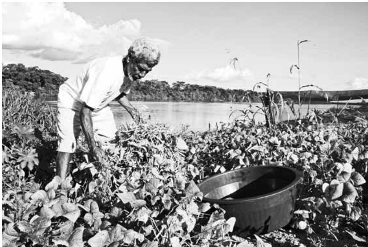
Albiai-Minas Gerais-Alto São Francisco