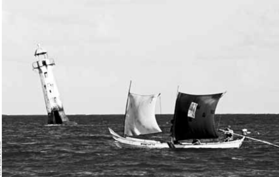
Farol do Cabeço-Foz do Rio-SE - Baixó São Francisco

Las comunidades rurales han alimentado al mundo por milenios. Hoy, la expansión masiva de la agricultura industrial de gran escala está destruyendo nuestra capacidad para seguir adelante. Continuamente estamos denunciando lo que va mal, mientras luchamos por un sistema alimentario justo y sustentable junto con las organizaciones campesinas y otros movimientos sociales. Este premio le da un tremendo empujón a estas luchas. Lo vemos no sólo como un reconocimiento a nuestro trabajo sino como un poderoso reconocimiento a las contribuciones de incontables personas y organizaciones involucradas en la lucha por una genuina soberanía alimentaria basada en la comunidad. Juntos, continuaremos esta lucha. No tenemos otra opción si hemos de sobrevivir en este planeta con alguna dignidad.